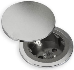
Kit copertura CIP 8000 115