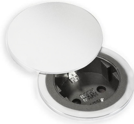
Kit copertura CIP 8000 215