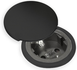
Kit copertura CIP 8000 315